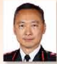
消防處處長 梁偉雄先生 FSDSM