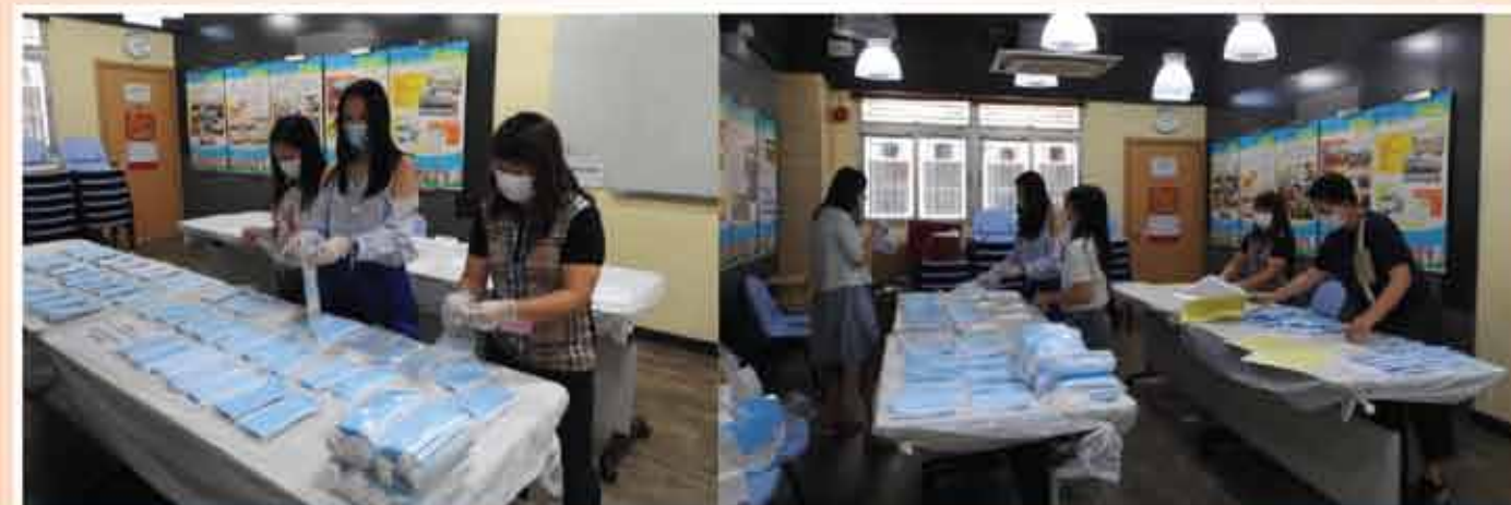
↑ 瑪利諾醫藥福利會的義工協助包裝防疫口罩