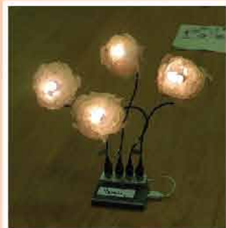
↑蒜頭燈工作坊 (2021年4月)

疫情之下，生活模式有所改變，情緒、壓力或者會影響居民身心靈健康。本會於疫情期間與樂滿坊準備了各類型的手工藝班，讓居民能在疫情中調節情緒，舒緩面對疫情所帶來的壓力，在心靈上提供支援，保持身心靈健康。參加者於課堂中表現投入及開心，而且參與人數眾多，本會亦配合市民需求，增設班組供後補人士參與。