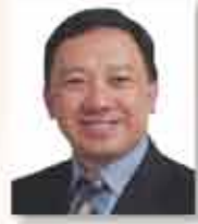
職業安全健康局主席 陳海濤博士 太平紳士