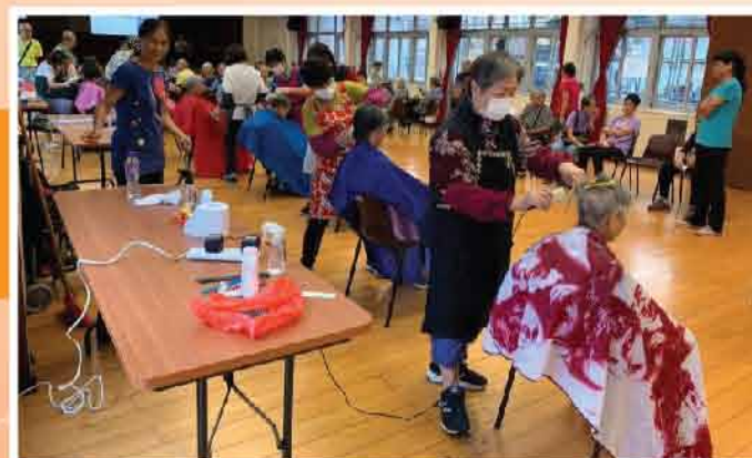
↑ 本會與社會福利署及黃大仙綜合家庭服務中心合作舉辦「家居安全話你知暨剪髮服務日」