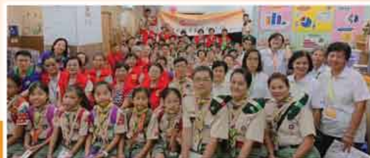
↑ 耆色團人進社區關愛計劃中秋敬老獻愛心活動2019義工探訪日