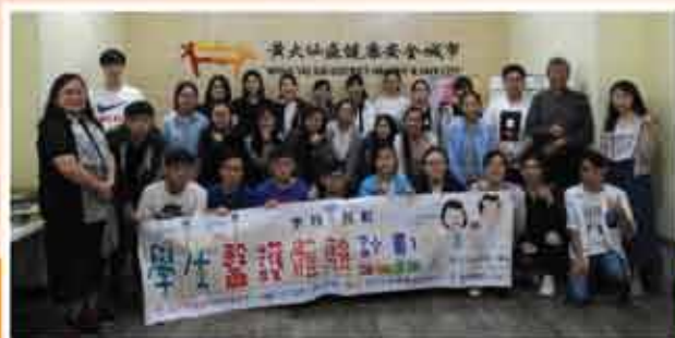
↑ 學生護護離離計劃2019