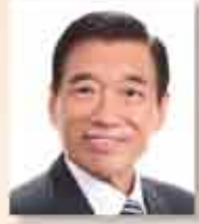
醫院管理局主席 范鴻齡 SBS 太平紳士