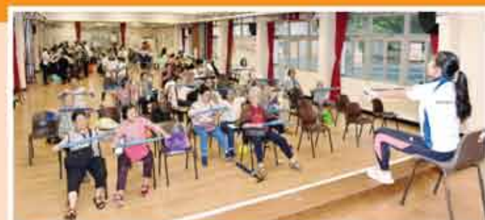
↑ 由東華學院學生帶領健康毛巾操及鈴操