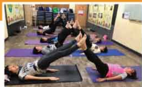
↑ 瑜珈班，自2017年開辦至今，共3,000人次參與