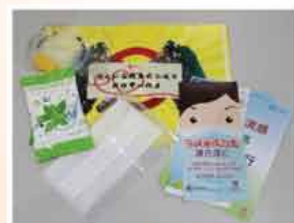
↑防疫包(口罩、濕紙巾及相關單張)