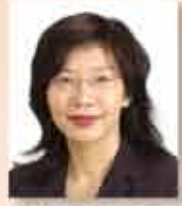
民政事務總署署長 副小華 太平紳士