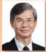
特工及福利局局長 蔣經國 GBS 太平紳士