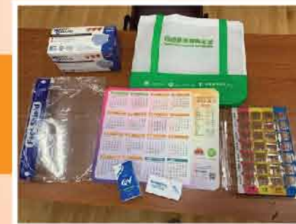
↑ 完成課堂可獲豐富防疫禮物包