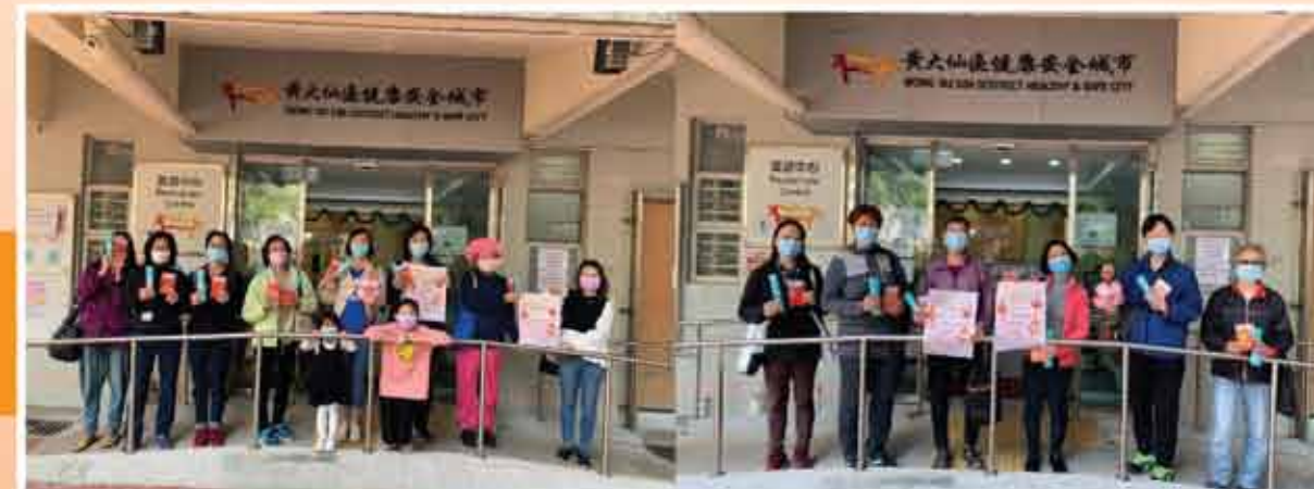
↑參加者分批到本中心領取工作坊材料包

本會推廣香港吸煙與健康委員會「深呼吸。煙不吸」，邀請市民利用二維碼登入網上活動網頁，支持無煙社區。