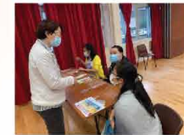
↑ 提供藥盒，並由藥劑師指導下實習執藥盒