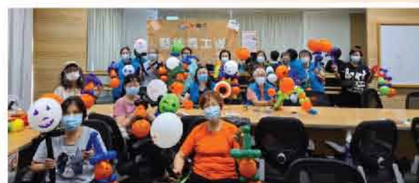
↑扭扭氣球樂工作坊 (2021年3月) (2020年10月)