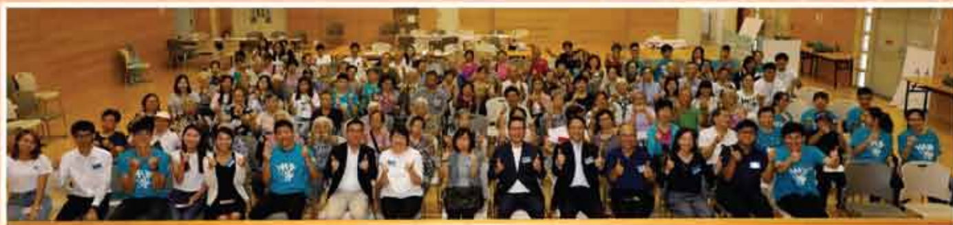
↑ 順德社區健康日2019：向中風說「不」