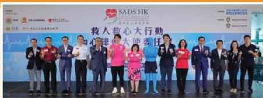
↑ 救人救心大行動暨心律會大使委任禮