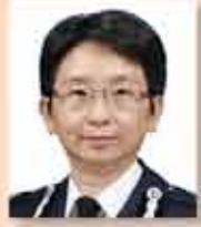
香港警務處 第九區總監指揮官 梁國潮女士