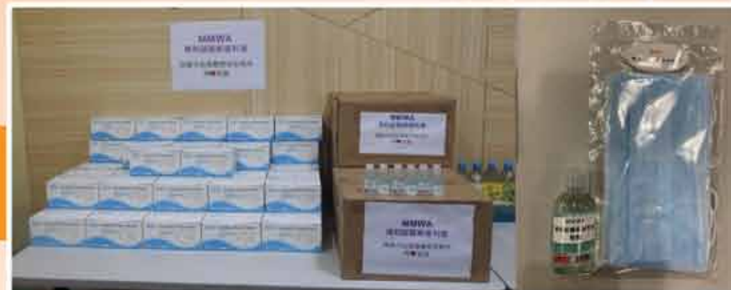
↑ 瑪利諾醫藥福利會捐贈的防疫口罩及酒精搓手液

瑪利諾醫藥福利會捐贈3,000枚防疫口罩及1,000支酒精搓手液。本會隨即聯繫黃大仙區內政府部門、社會福利署黃大仙綜合家庭服務中心(600份防疫口罩及酒精搓手液)及地區機構-樂滿坊(200支酒精搓手液)協作，向有需要人士派發防疫用品，共同扶助弱勢社群。