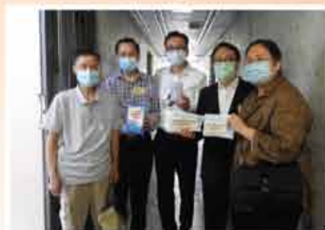
↑ 善色團董事會一眾成員 探訪橫頭磡邨長者戶，送上防疫物資