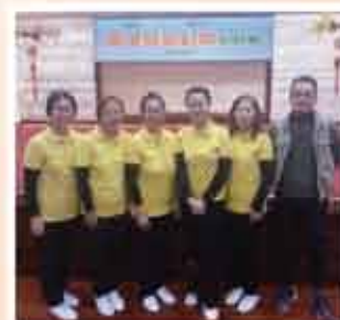
↑ 香港安全社區研討會