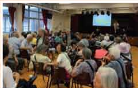
↑ 家居安全話你知暨剪髮服務日