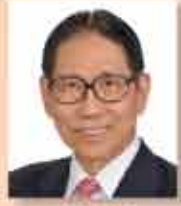
副警務總監 蘇國潮 GBS OBE 太平紳士