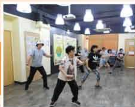
↑ 太極班，自2017年開辦至今，參與人次高達4,000