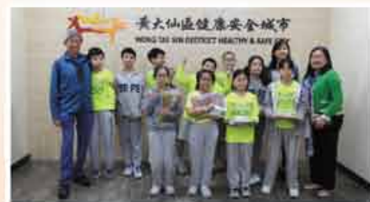
↑ 滙信會天虹小學dreamstarter交流