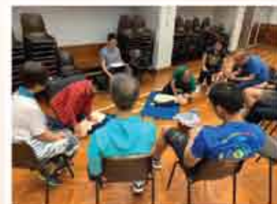
新增兒童急救課程，配合社區需求，參與反應熱烈