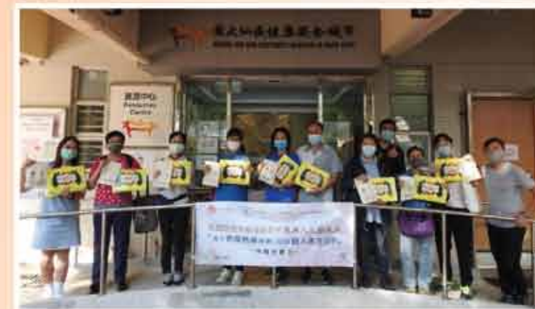
↑參加者分批到本中心領取禮物包