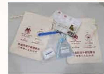
↑防疫手工肥皂、抗疫中草隨身包