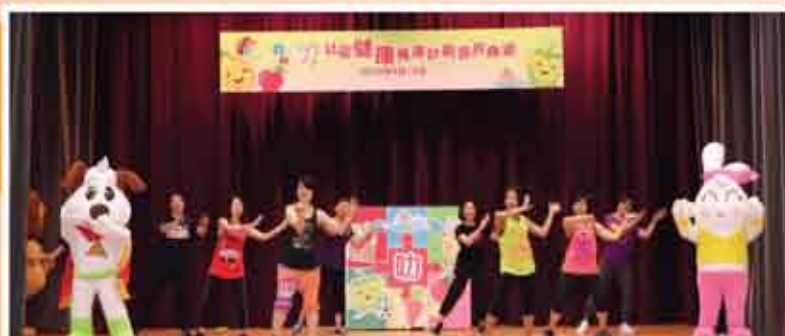
↑ 我好叻社區健康推廣計劃嘉許典禮