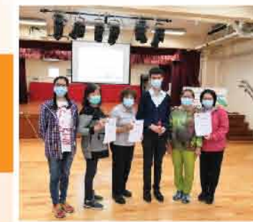
↑ 完成一系列課堂可獲參與證書