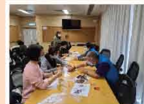
↑和風布花飾物工作坊 (2021年3月)