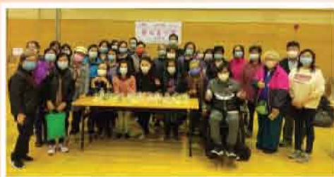
↑寶石皂心靈工作坊 (2021年3月)