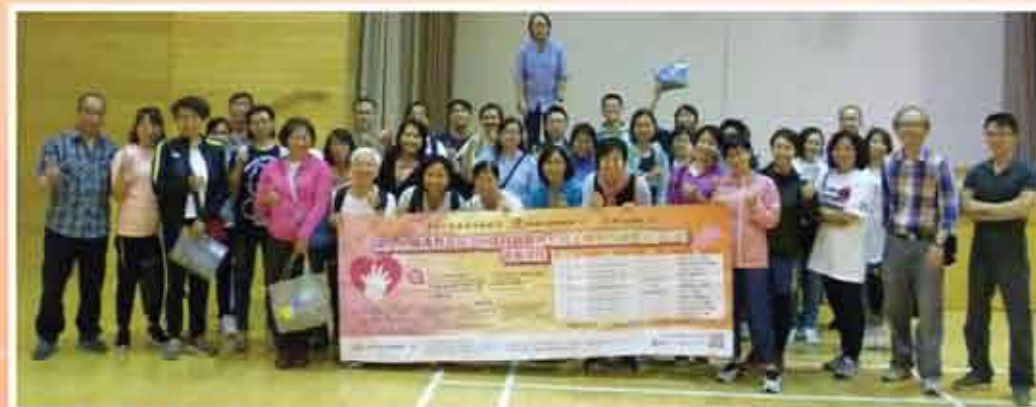
↑ 心肺復甦法(CPR)及自動體外心臟去纖維性顫動法(AED)課程，參與人數超越600人