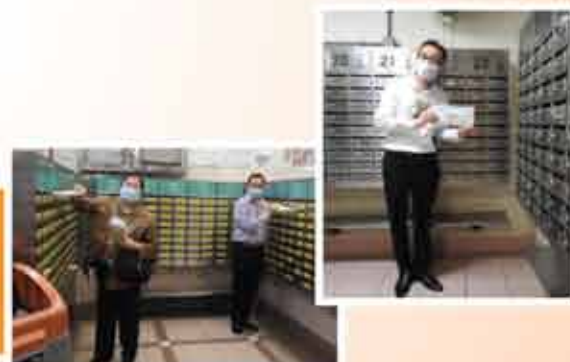
↑ 將防疫口罩投進屋邨信箱，讓更多黃大仙居民受惠