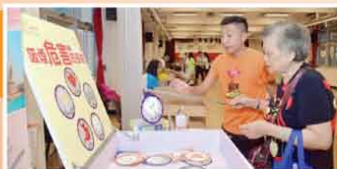
↑ 無煙社區攤位遊戲