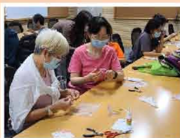
↑捕夢網匙扣工作坊 (2020年11月)