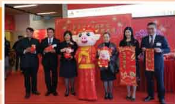
↑ 新春酒會暨銘謝狀及卓越貢獻獎頒獎典禮