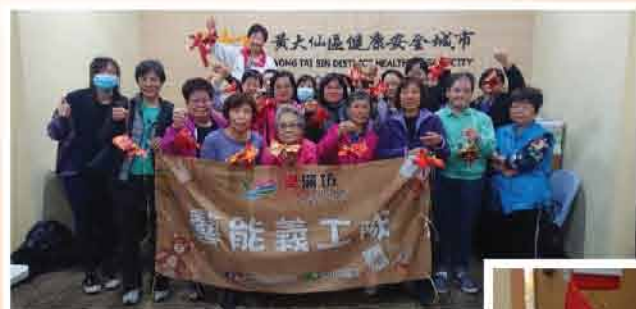
↑賀年金魚掛飾工作坊 (2020年1月)