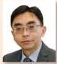
副主席兼當然董事 副總經理