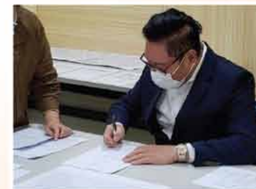
↑ 由史德主席代表董事局簽署 黃大仙康健中心計劃書

黃大仙區康健中心工作小組 (WTS DHC Task Force) 於2018年11月 - 2020年4月期間召開多次會議，商討黃大仙康健中心的服務細節，撰寫計劃書。