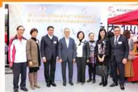
↑ 摩士公園的康樂設施改善工程開幕典禮