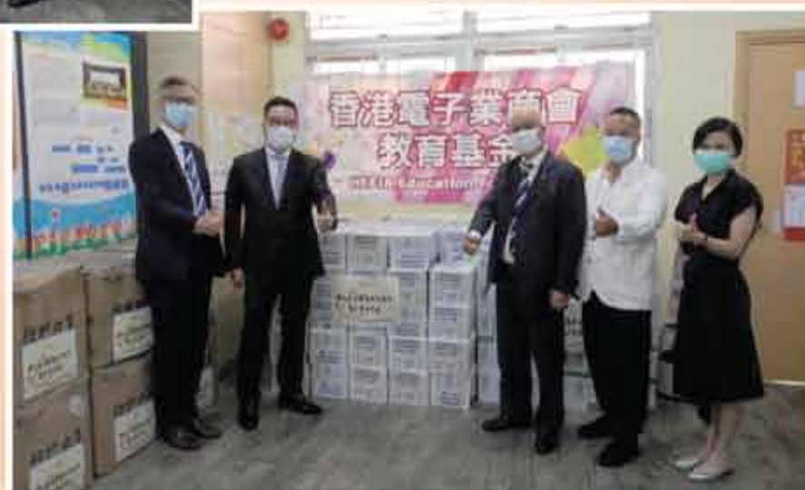
↑ 香港電子業商會教育基金慷慨捐贈1,000支洗手液及600包消毒紙巾