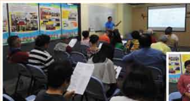
↑ 聽歌學英文自2017年開辦至今，共3,000人次參與