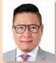
主席 史立德博士 BBS MH 太平紳士