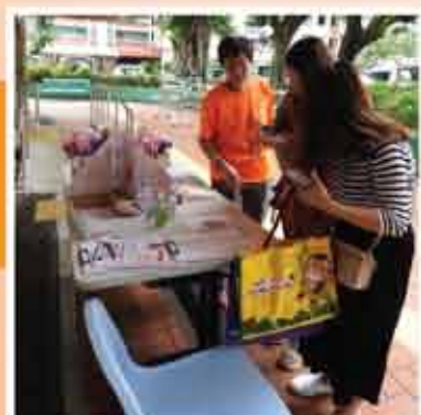
↑ 節日活動，每個活動約100人受惠