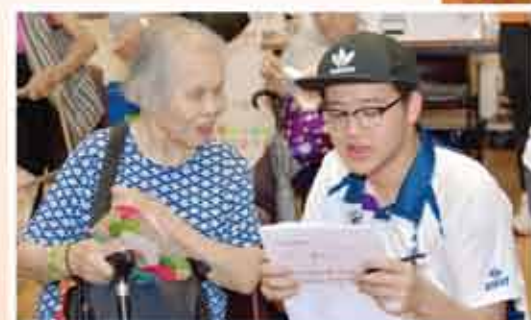
↑ 由聖母醫院同工及東華學院學生為參加者做健康檢查及評估