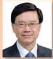
保安局局長 李家超 SBS PDSM PMSM 太平紳士