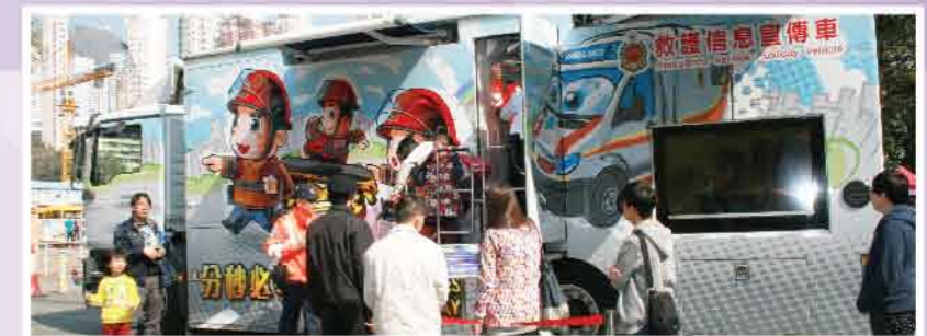
↑ 與消防處合作，提供宣傳車供市民參觀