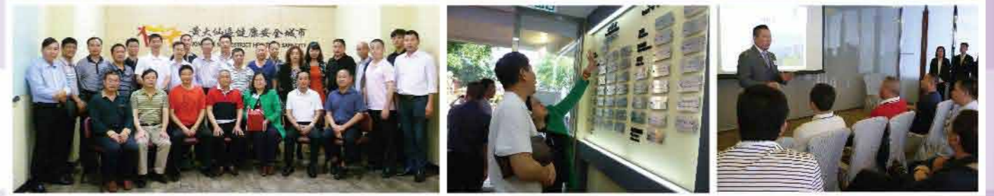
接待國內外「安全社區」考察團