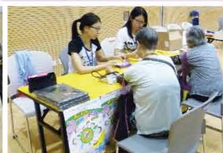
↑設有攤位遊戲讓市民了解更多無煙訊息