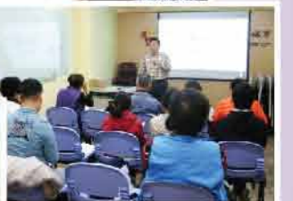
← 聽歌學英文 (20015-2017)