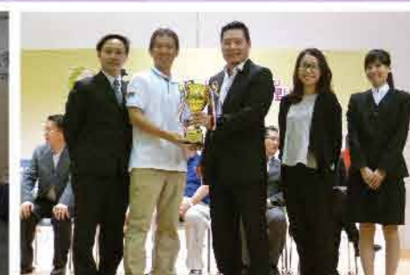
↑ 獲得「安全小社區」獎項的屋苑