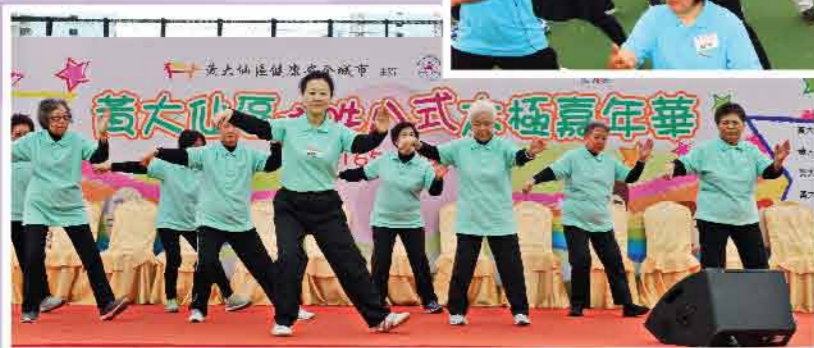
↑ 黃大仙區防跌八式太極嘉年華