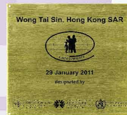
↑ 「國際安全社區」協議及證書