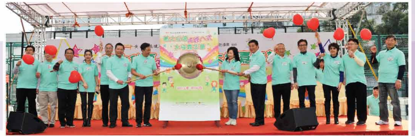
↑ 2016「黃大仙防跌八式太極嘉年華」開幕儀式

太極運動一向深受本區居民歡迎，本會於2010年開始區內進行太極運動，並於2013年大力推廣由區內多位太極師傅共同創立獨特的黃大仙區「防跌八式」。透過舉辦一連串的太極班組、大型匯演暨嘉年華，宣揚老少咸宜的太極運動，藉此向居民提倡健康生活的重要性及提高防跌意識。