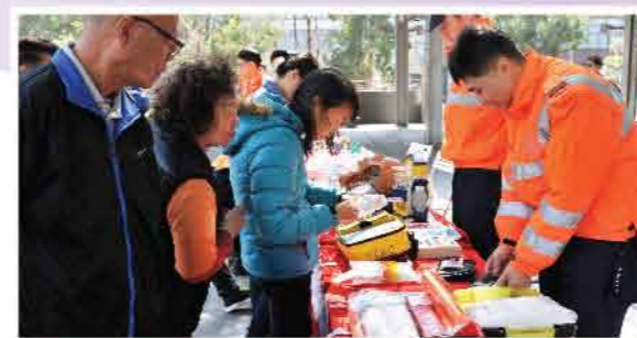
↑ 展示日常使用的器材，增加居民對救護的認識