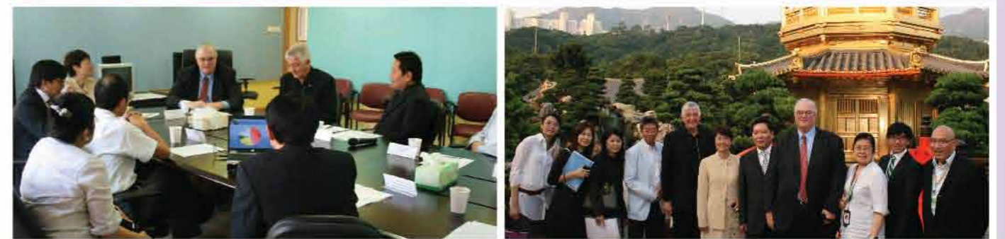
↑國際安全社區認證中心及澳洲安全社區協會代表到訪黃大仙區