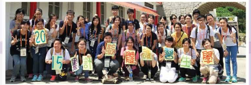
↑2015學生醫護體驗計劃