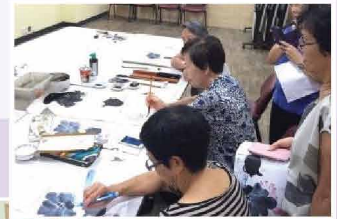
← 書法及國畫班 (20015-2017)