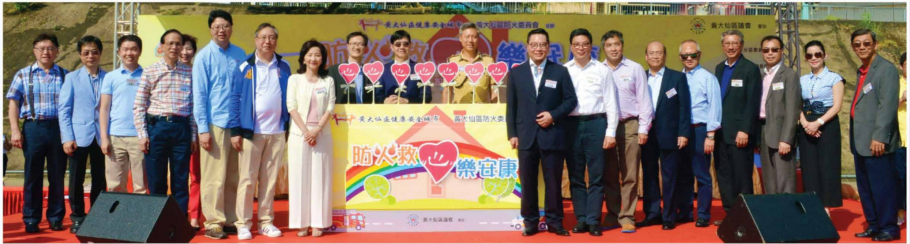
↑ 15/10/2016 消防救心樂安康