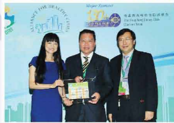
↑本會獲頒發 Outstanding Poster Award