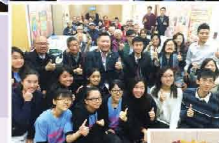
↑ 關懷社區健康日 (17, 20/12/2015)