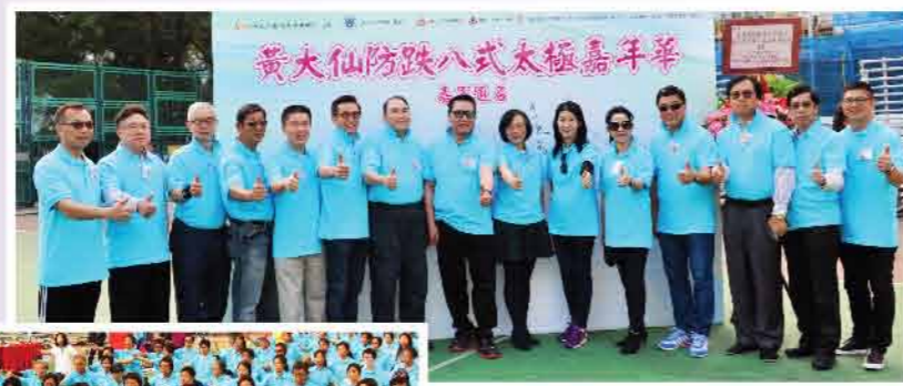
← 一眾嘉賓與太極班學員一起大耍太極