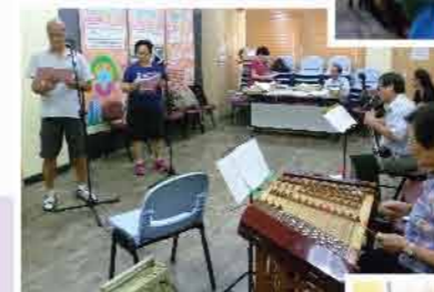
↑ 粵曲班 (20015-2017)