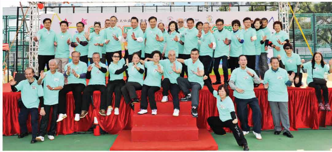
↑ 眾主禮嘉賓到台下與黃大仙居民進行「黃大仙防跌八式」大匯演