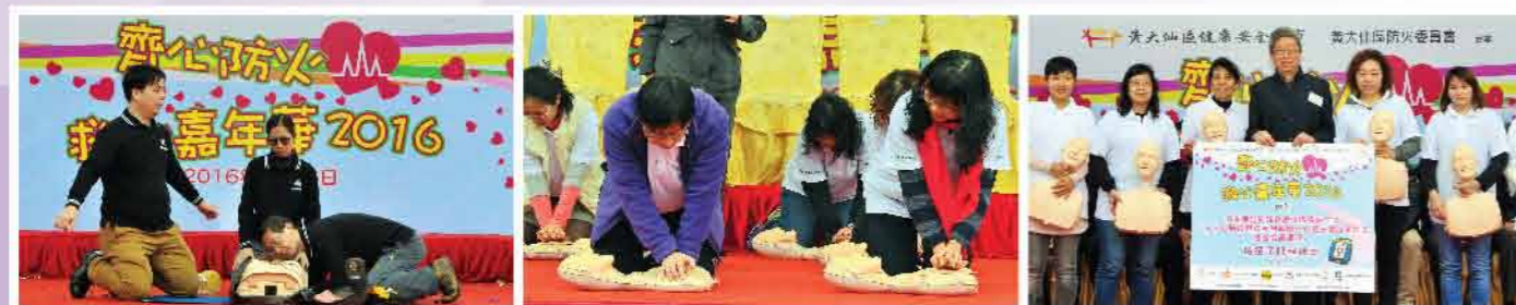
↑ 心肺復甦及自動體外心臟去顫法(AED)示範