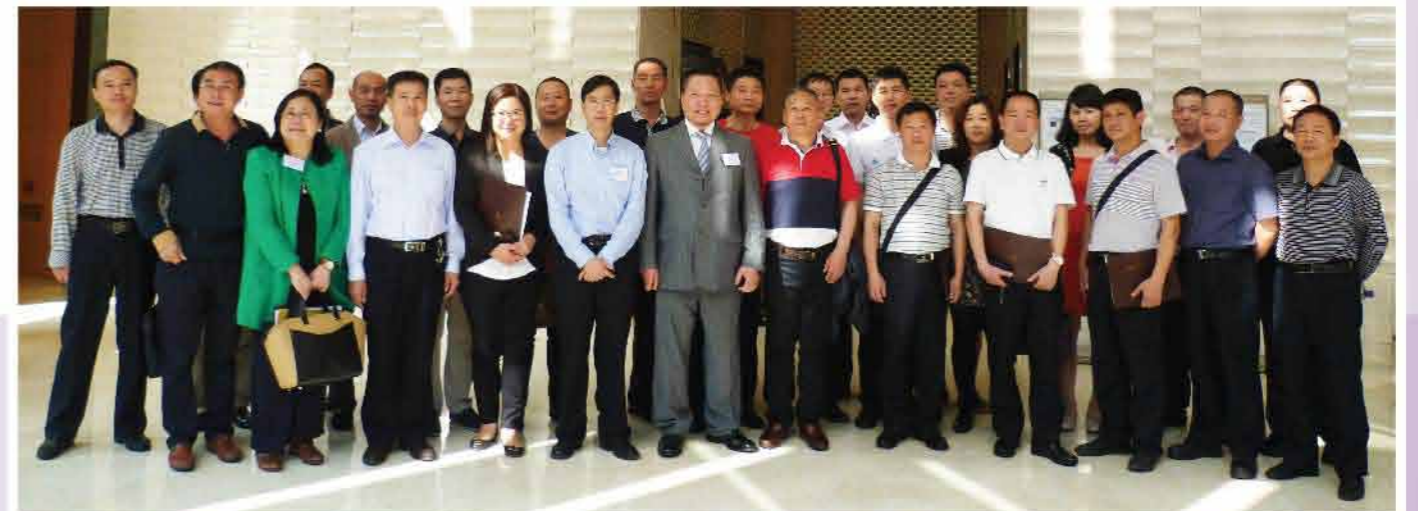
2015 福建省安全生產監督管理局到訪黃大仙區