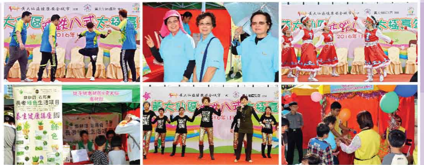
↑ 其他項目表演及攤位活動