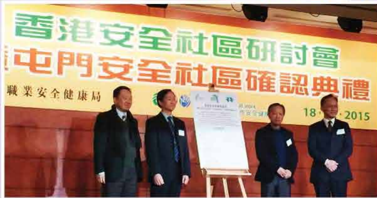
2015 香港安全社區研討會暨屯門社區確認儀式