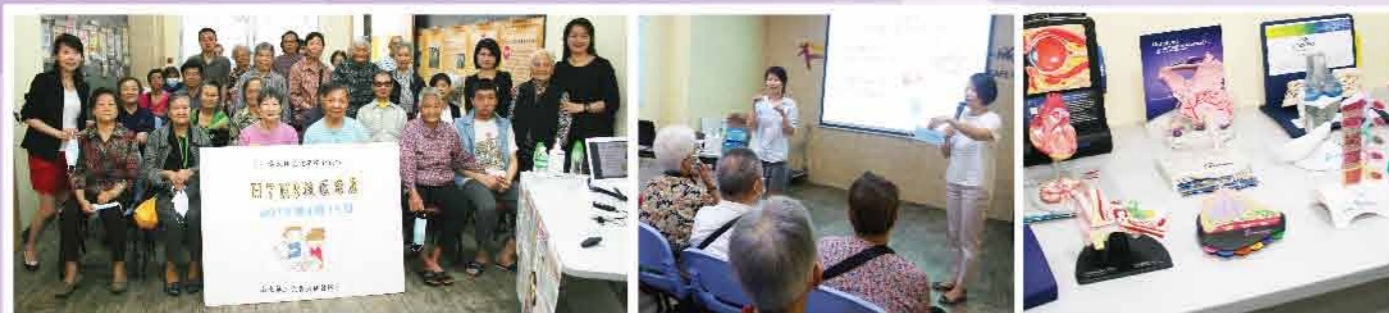
↑ 定期舉辦講座，向居民宣揚安健訊息