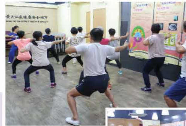
↑ 八段錦氣功班 (2015-2017)