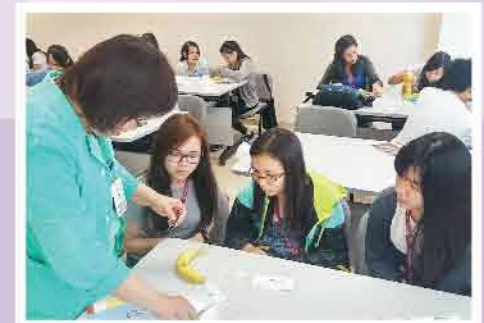
↑進行簡單試驗及導師講解