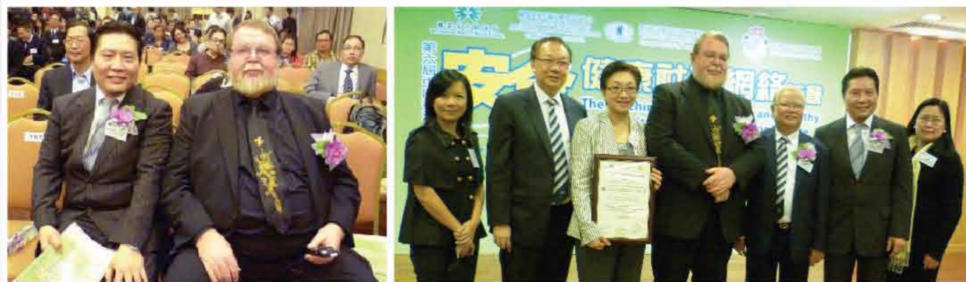
↑史立德主席與前世界衛生組織社區安全推廣協理中心溫思朗教授合照