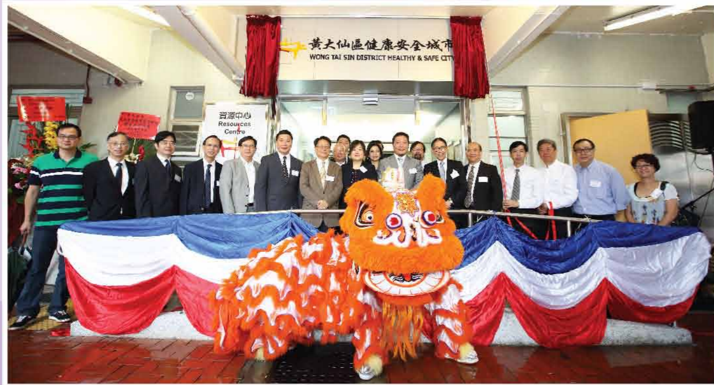
↑ 資源中心開幕典禮