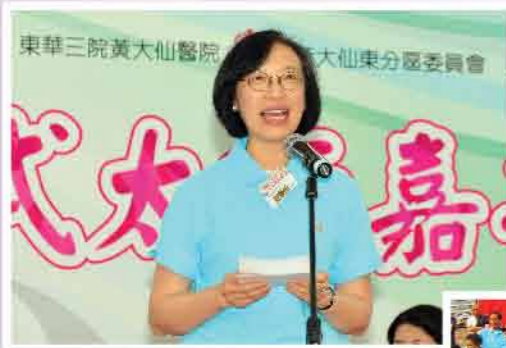
↑ 食物及衛生局陳肇始副局長出席參與

自2010年，本會按年舉辦多元化的嘉年華，提高長者的防跌意識，向本區居民提倡健康生活的重要性。另外，亦透過宣揚「太極」運動，帶出做運動是構成為健康生活不可缺的元素的訊息。本會更多次請來區內的名師領操，召集區內學校及長者組織，共同參與及分享，響應全民運動的理念。健康安全的生活環境。