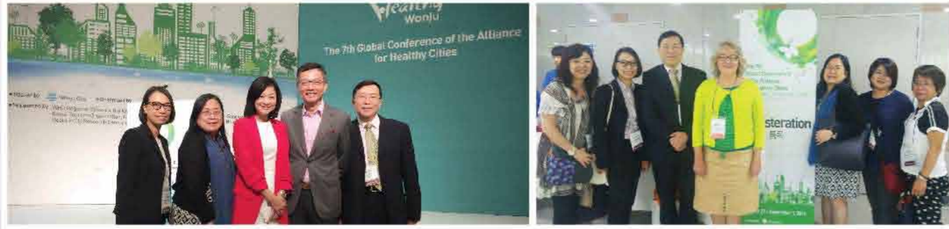
2016 第七屆健康城市聯盟國際大會