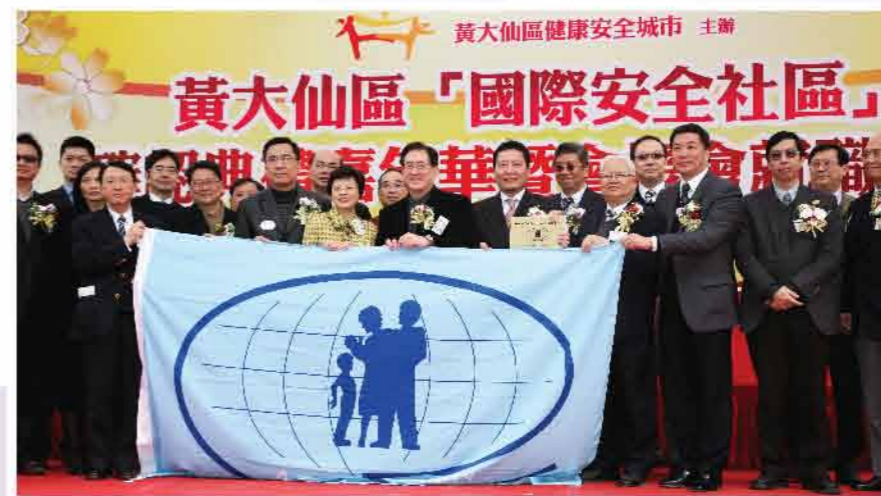
↑ 黃大仙區確認為世界第227個「國際安全社區」